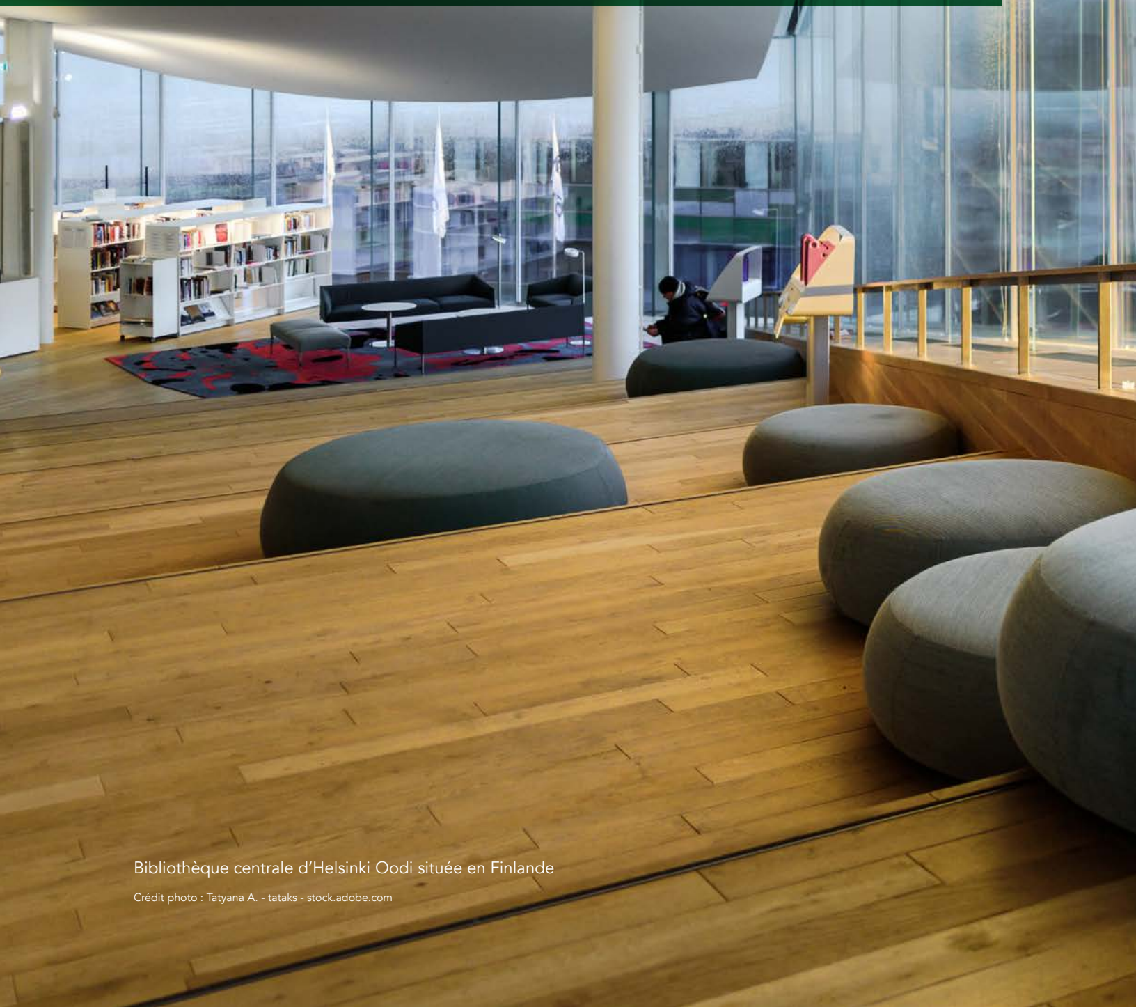
Bibliothèque centrale d'Helsinki Oodi située en Finlande

Lignes directrices pour les bibliothèques publiques du Québec (2019)