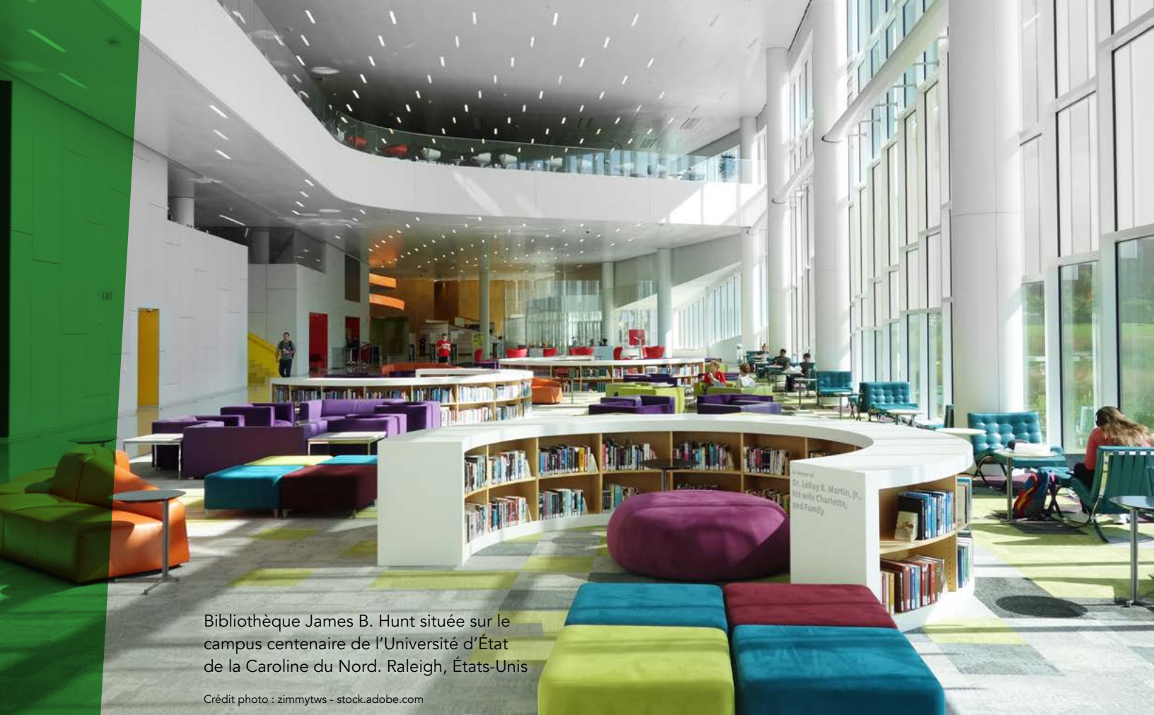
Bibliothèque James B. Hunt située sur le campus centenaire de l'Université d'État de la Caroline du Nord. Raleigh, États-Unis